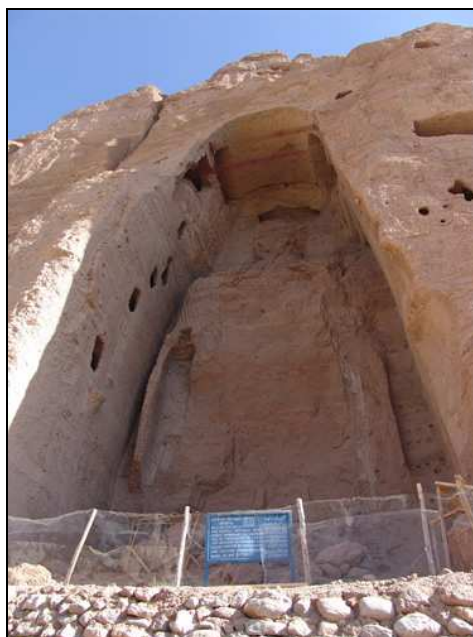
(L'emplacement vide d'un des bouddhas en août 2005, 4 ans après l'attaque) 7