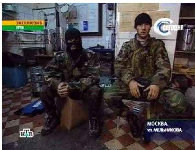
(Chefs du commando terroriste dans le théâtre)

Les théâtres, en raison de leur configuration close, renvoient à la problématique classique potentielle des prises d'otages, entre cohésion interne et dissensions parmi les terroristes au fur et à mesure que la fatigue et les tensions s'accroissent, les caractéristiques du bâtiment et des otages, les possibilités offertes pour les forces contre-terroristes ; voire pour les victimes, les risques d'un syndrome de Stockholm 24 . La crise du théâtre de Moscou semble avoir entraîné une prise en compte assez généralisée de la part des forces contre-terroristes d'intervention à travers le monde. La fusion du GIGN et de l'EPIGN en France a été réalisée avec ce but principal de favoriser la montée en puissance d'une force à même de contrer une prise d'otages « massive » (POM) qui semble un peu hypothétique en France 25 .